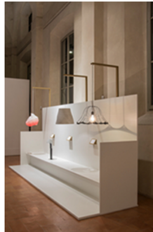
Ausstellungsansichten „Confession of Design“ am Eröffnungstag

Im Scheinwerferlicht der CREATIVE REGION sind in der „Rotanda della Besana“ (Veranstaltungsort in Mailand) aufregende Zeugnisse heimischer Gestaltungskunst zu sehen: von der filigranen Leuchte „Crochet“, dem grafisch anmutenden Couchtisch „Tria“, der poetischen Schmuckserie „Zwei“, den multifunktionalen Körben „Lampienta“ bis hin zur limitierten Stuhlserie „Austria 2.0 Chair“ und den mundgeblasenen Glasobjekten „Emissaire“, die zu spielerischen Reflektionen anregen. (Detailinformation auf separatem Projektblatt).