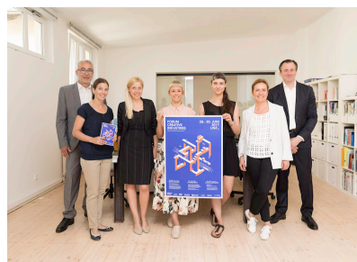
Bild 1: Kampagnenfoto „Redesigning Upper Austria“ – OrtnerSchinko – A Creative Studio